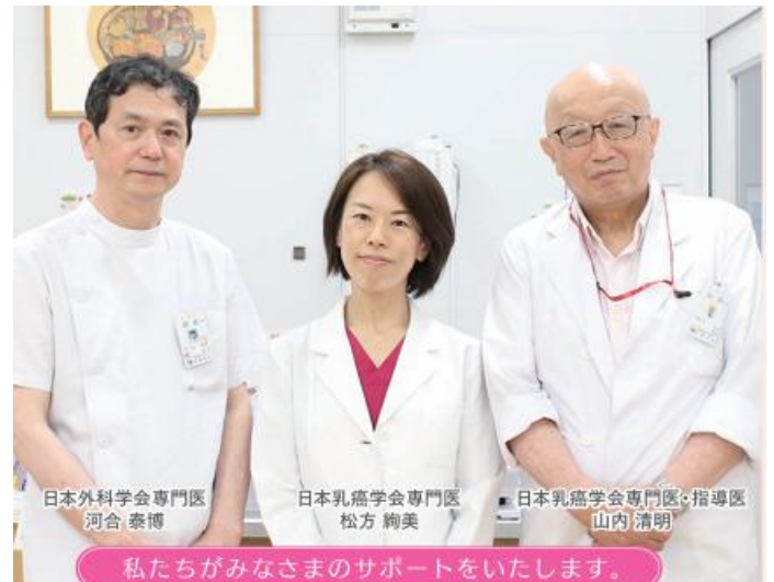
私たちがみなさまのサポートをいたします。

夜間の放射線治療についても実施しており、働きながらのがん治療サポートを行っておりますので、地域医療連携室までご相談ください。