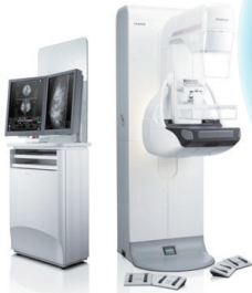
富士フィルムメディカル社製 AMULET Innovality