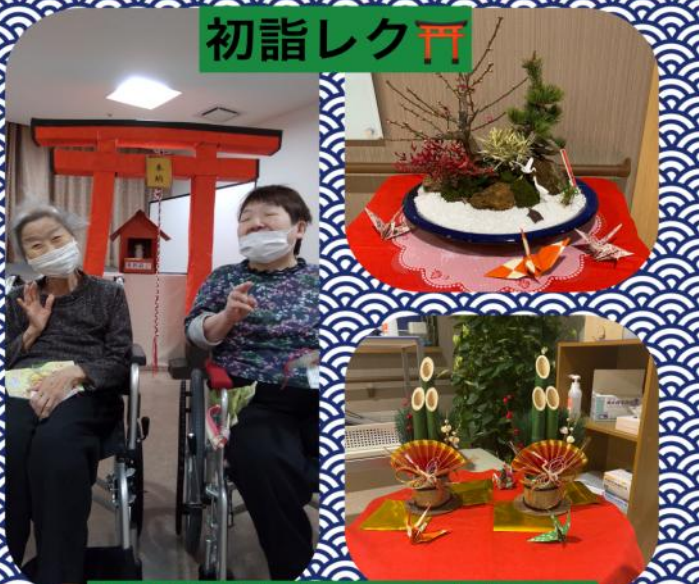
特別養護老人ホーム大枝美郷