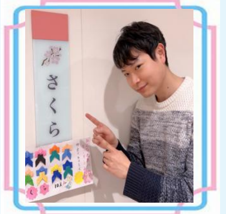
3階さくらユニット