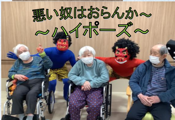
悪い奴はおらんか～ ～ハイポーズ～