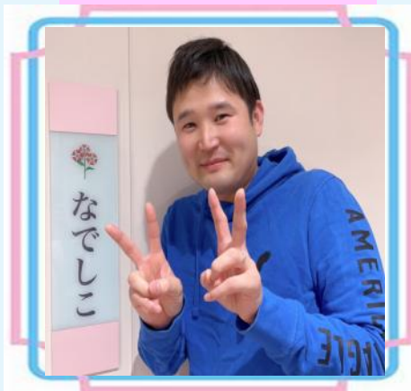
2階なでしこユニット

一言:利用者さん一人ひとりと 人らしく笑顔で過ごしていただ けるようなケアを目指しま す!!