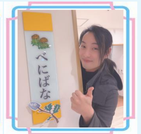
2階べにばなユニット

一言:体力的にいつまで続けられ るか分かりませんが、答えのない 仕事。最後まで自分なりに、 じっくり・しっかり向き合って いきたいと思ひます