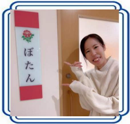
3階ぼたんユニット

一言:利用者さんに1日1回 笑ってもらおう!!をモットーに、 楽しく過ごせるユニット作りを していきたいと思います!!