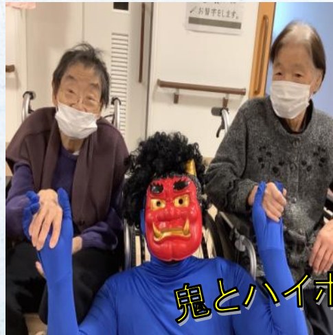
鬼とハイポーズ(笑)