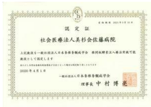
実施可能施設認定証