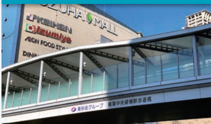
美杉会グループ楠葉中央線横断歩道橋