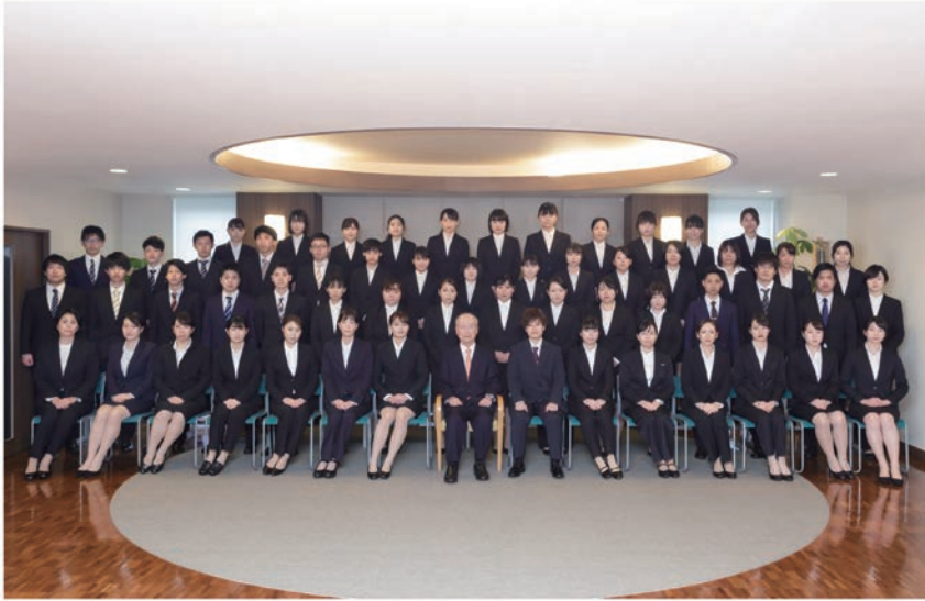
美杉会グループ 令和2年4月1日 新入職員入社式