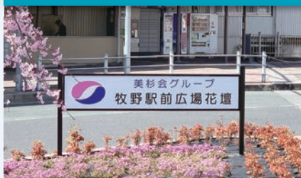
美杉会グループ牧野駅前広場花壇