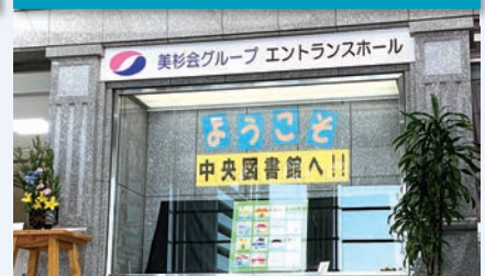
美杉会グループエントランスホール