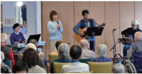
この収録の様子は十二月五日に番組放送されました。