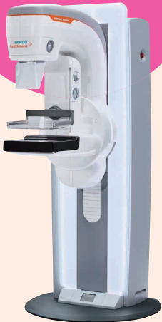
SIEMENS社製 MAMMOMAT Revelation