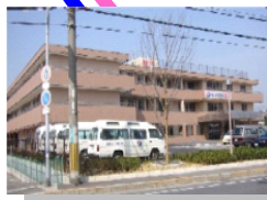
介護老人保健施設美杉