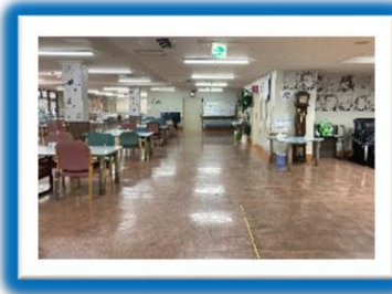
車椅子の方でも移動しやすい通路