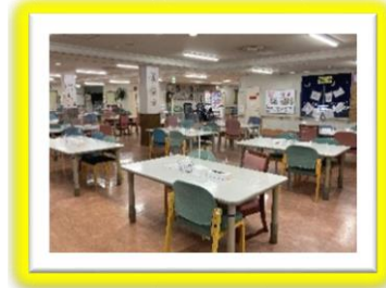
落ち着いて取り組める作業・脳トレスペース ＜刺し子・塗り絵・かご作りなどができます＞ お風呂や体操への移動もスムーズに