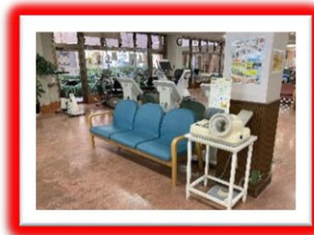
運動前後に血圧チェック