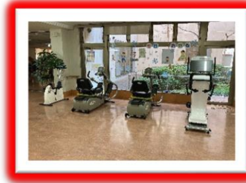
ニューステップやコグニバイク等の運動機器を配置 リハビリ終わりにもう少し・・・ 空いた時間を有効活用