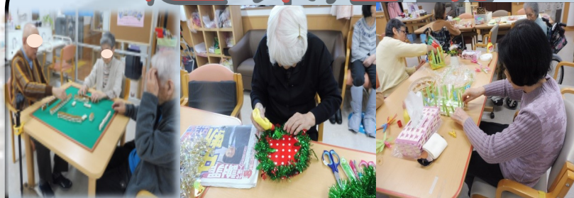
色々な作業に取り組まれています。