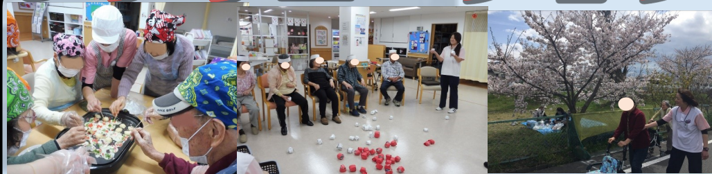
手作りおやつ、外出レク、リズム教室等楽しい企画をご用意