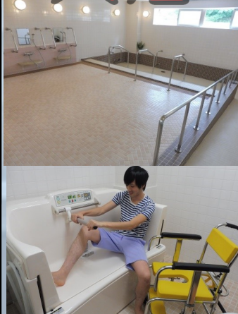
大浴場・個浴・寝台浴槽を完備