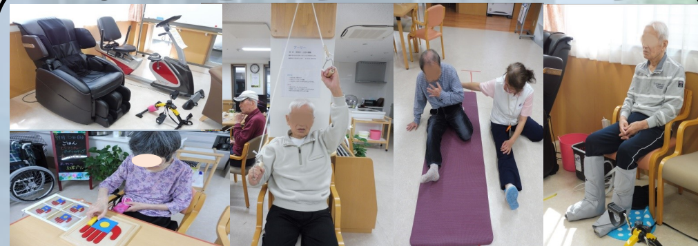
脳トレ、手指運動、各種リハビリ道具も充実しています