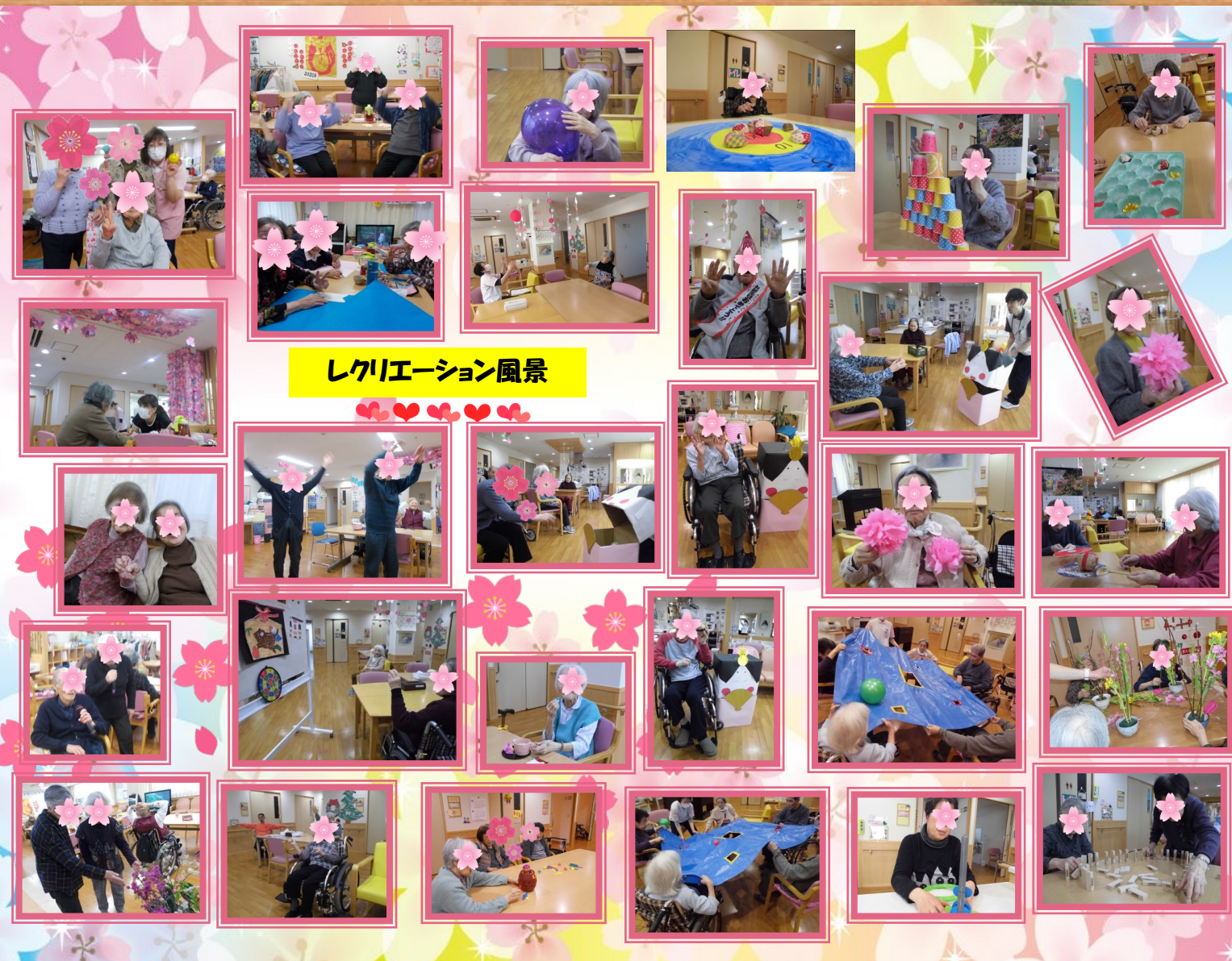
レクリエーション風景